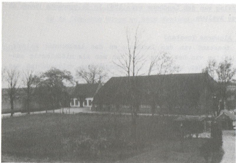
Boerderijcomplex " 's Heerenbuis" (ca 1850)