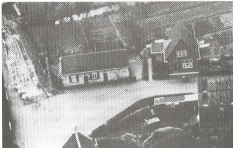
Een foto van 't Hoekske van den Hellekant.