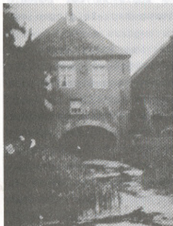
Foto van het woonhuis.