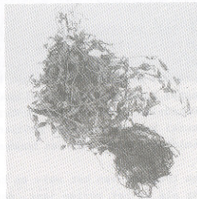
De meekrap kon in het tweede jaar worden gedolven, maar wie het volle profijt van de wortels wilde trekken, oogtte pas het derde jaar.

De gedolven meekrap is tweejarig, aangezien alhier geen andere wordt gedolven. Meestroof of fabriek bestaat in de gemeente niet. De prijs van dit produkt is zeer laag en komt op f 30,- à f 32,- per honderd Nederlandse ponder neder, en door deze lage prijzen is oorzaak er weinig geteelt wordt.