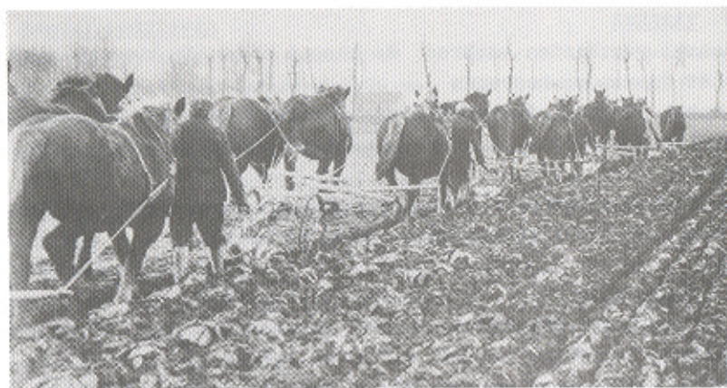
Met voldoende paarden, ploegen en mankracht kon ook voordat de tractor zijn intrede had gedaan, in hoog tempo een stuk land worden omgelejd.

Niets bijzonders op te merken omtrent de aanfokkerij. De gezondheidstoestand was bevredigend en geene heerschende ziekte hebben er onder de paarden geheerscht.