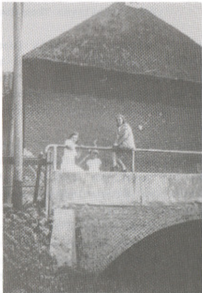
Een betonnen muurtje met ijzeren reling.

Toen de Duitsers tegen het einde van de Tweede Wereld oorlog zagen aankomen dat het voor hen een verloren zaak begon te worden, waren zij aanvankelijk van plan de zaak onder water te zetten; daarom werd 'de Heul' dichtgezet met baaltjes pure cement. Het resultaat was niet wat zij ervan verwacht hadden. De landerijen kwamen slechts 'dras' te staan.